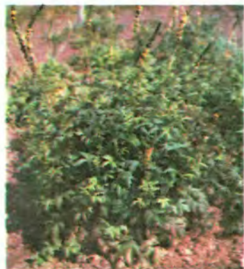
28. Парило звичайне.